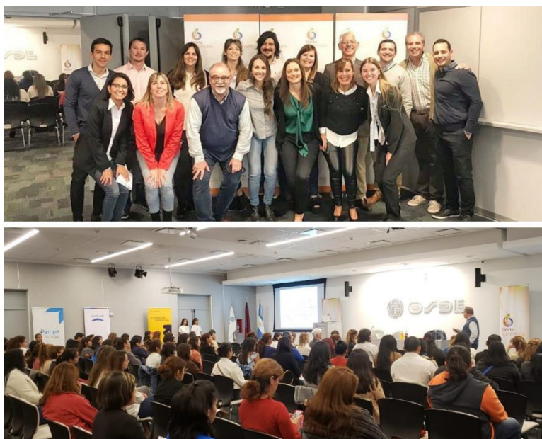
*Imagen del Seminario en Sustentabilidad y Responsabilidad Social para docentes dictado en el año 2019 en Salta.

global donde se promueve la Sustentabilidad, y entre ellas se incluyen específicamente contenidos de Pacto Global, Objetivos de Desarrollo Sustentable (ODS), la Encíclica Laudato Si, por mencionar algunas.