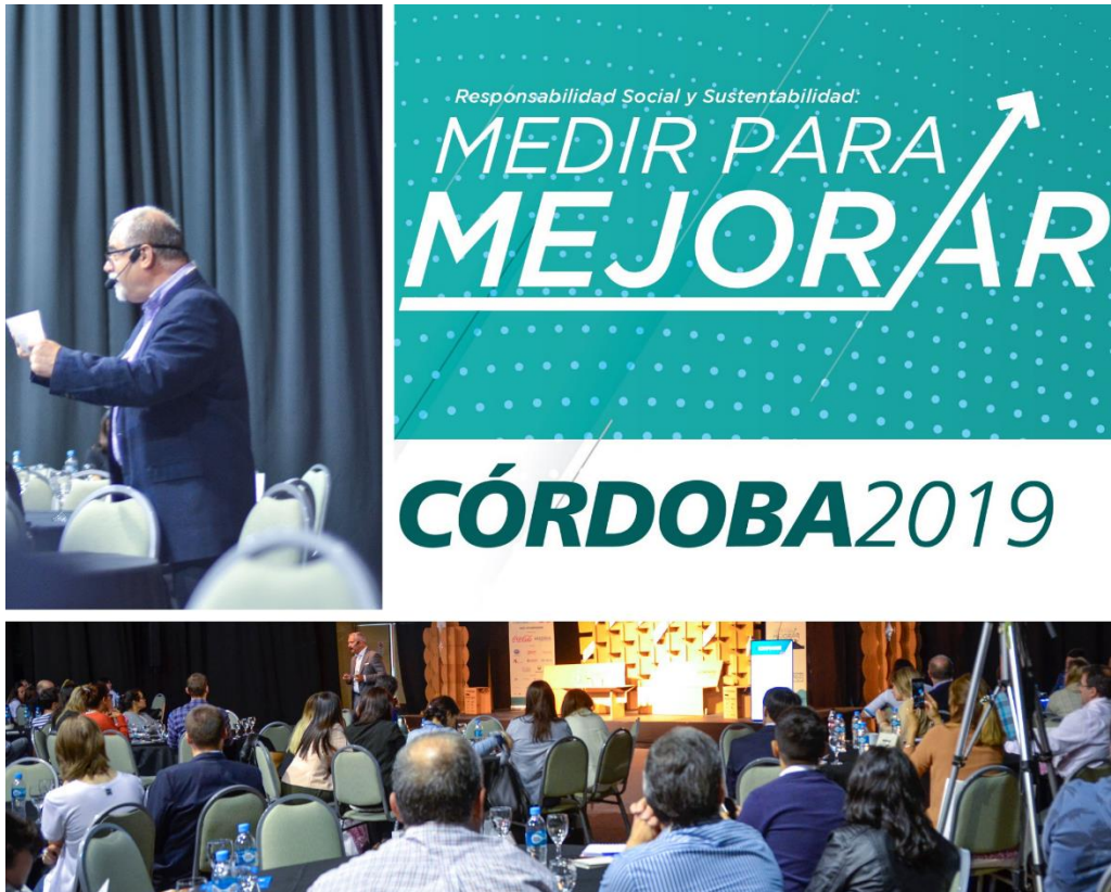
*Registro fotográfico de la Conferencia Internacional IARSE en Córdoba año 2019.